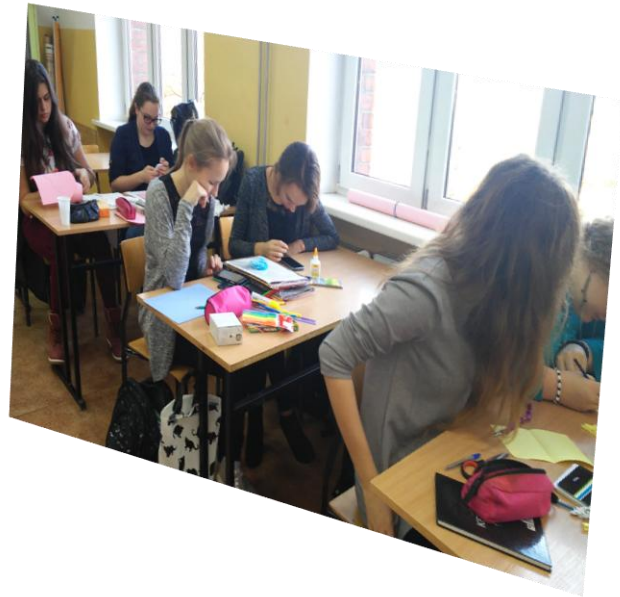
Fot. B. Drzewiecka - prace uczniów klasy 2tor.