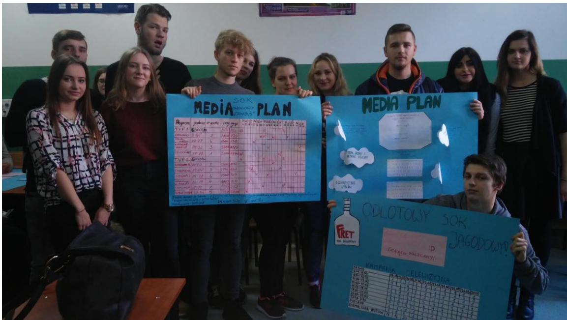
prace uczniów klasy 4tor.

Pani Jolanta Kaczmaryk przeprowadziła lekcję otwartą w klasie 1tor nt. „Koncepcja marketingu MIX”. Jej celem było wykorzystanie w praktyce rynkowej wiedzy i umiejętności zdobywanych na tradycyjnych lekcjach.