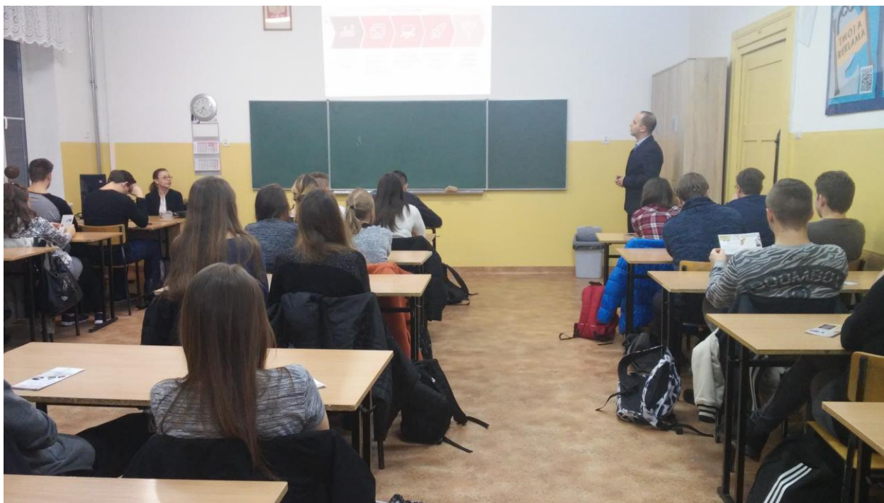
spotkanie uczniów z firmą Doris Spa.