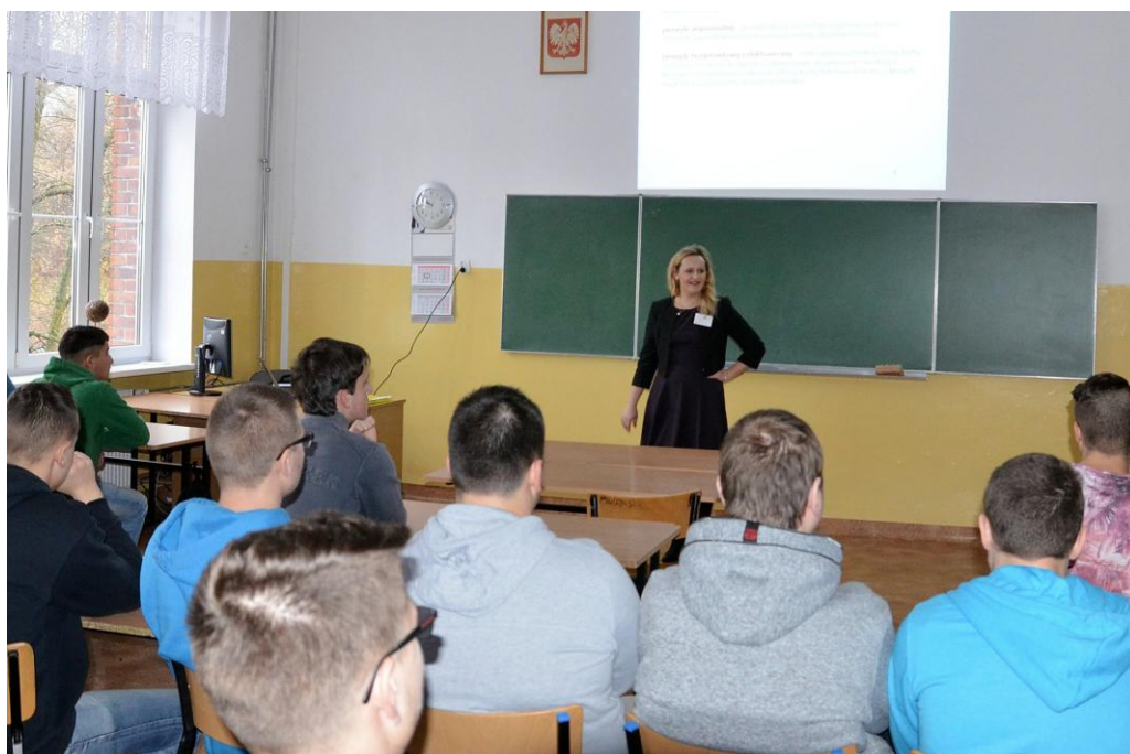
spotkanie z PKO BP w Koszalinie